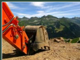
2° Premio Ivan Dossi