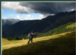
1° Premio Angelo Bertola

Ogni partecipante deve fornire da un minimo di una (1) a un massimo di 4 immagini.