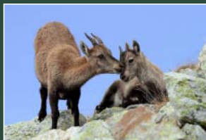
Opera segnalata Alfredo Zambelli