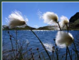
3° Premio Ivan Gualtieri